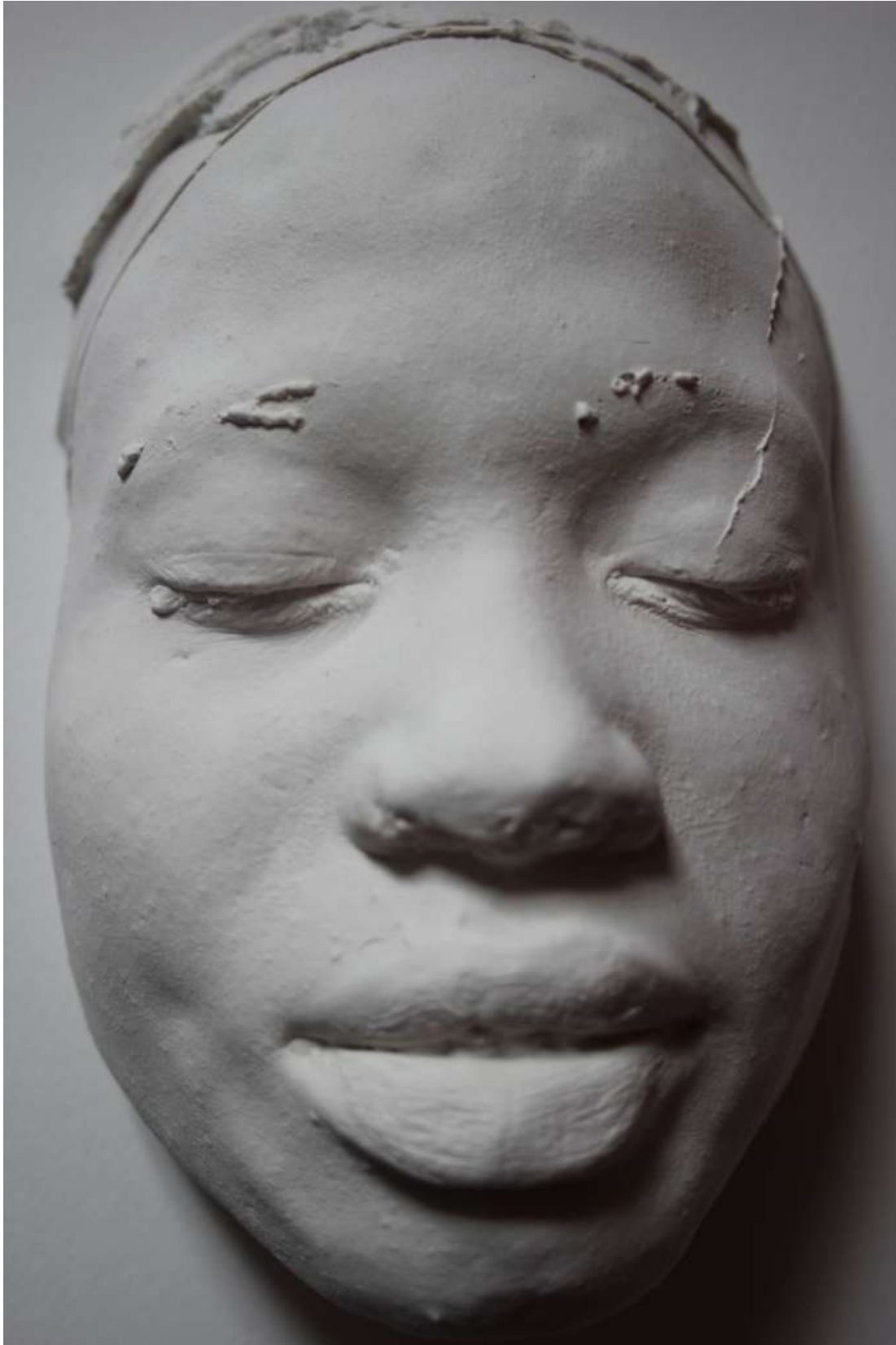
« Figure Oubliée », de Amina Zoubir (2014).

Comme Kahena, féministe avant l'heure, les créatrices ici réunies ne s'en laissent pas compter. Si elles manient parfois des techniques prétendument réservées aux femmes, elles en dynamitent la dimension « ouvrage de dame ».